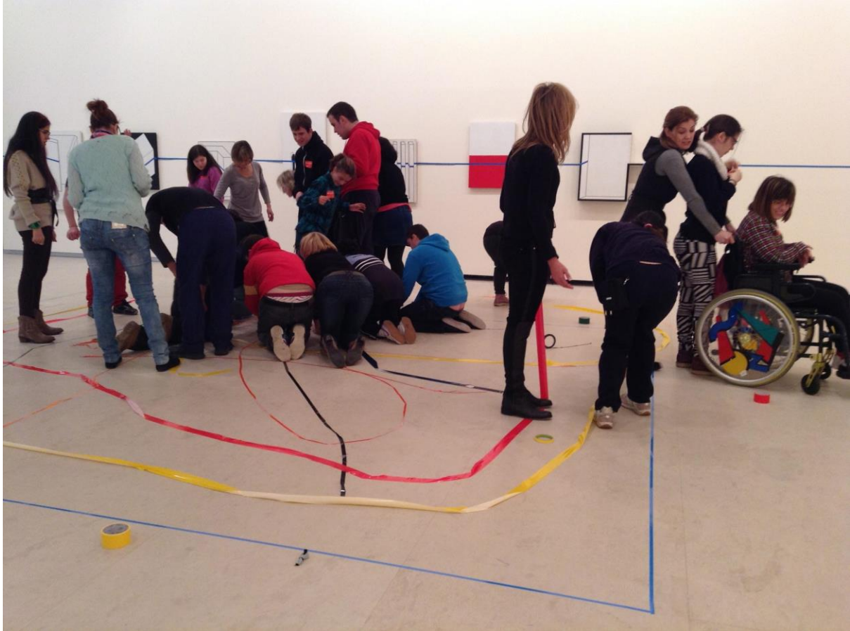
Sala de Arte Fundación Banco Santander. Arte Accesible. Pedagogías Invisibles. 2013.

En este marco, tenemos una amplia experiencia en la puesta en marcha de proyectos que incluyan a las personas con discapacidad intelectual (diversidad funcional cognitiva) como sujetos activos en el desarrollo de propuestas educativas basadas en la creatividad, facilitando el encuentro de las diferentes capacidades, lenguajes y estilos de interacción como características que hacen de las personas con diversidad funcional cognitiva en productores culturales valiosos en nuestra sociedad.