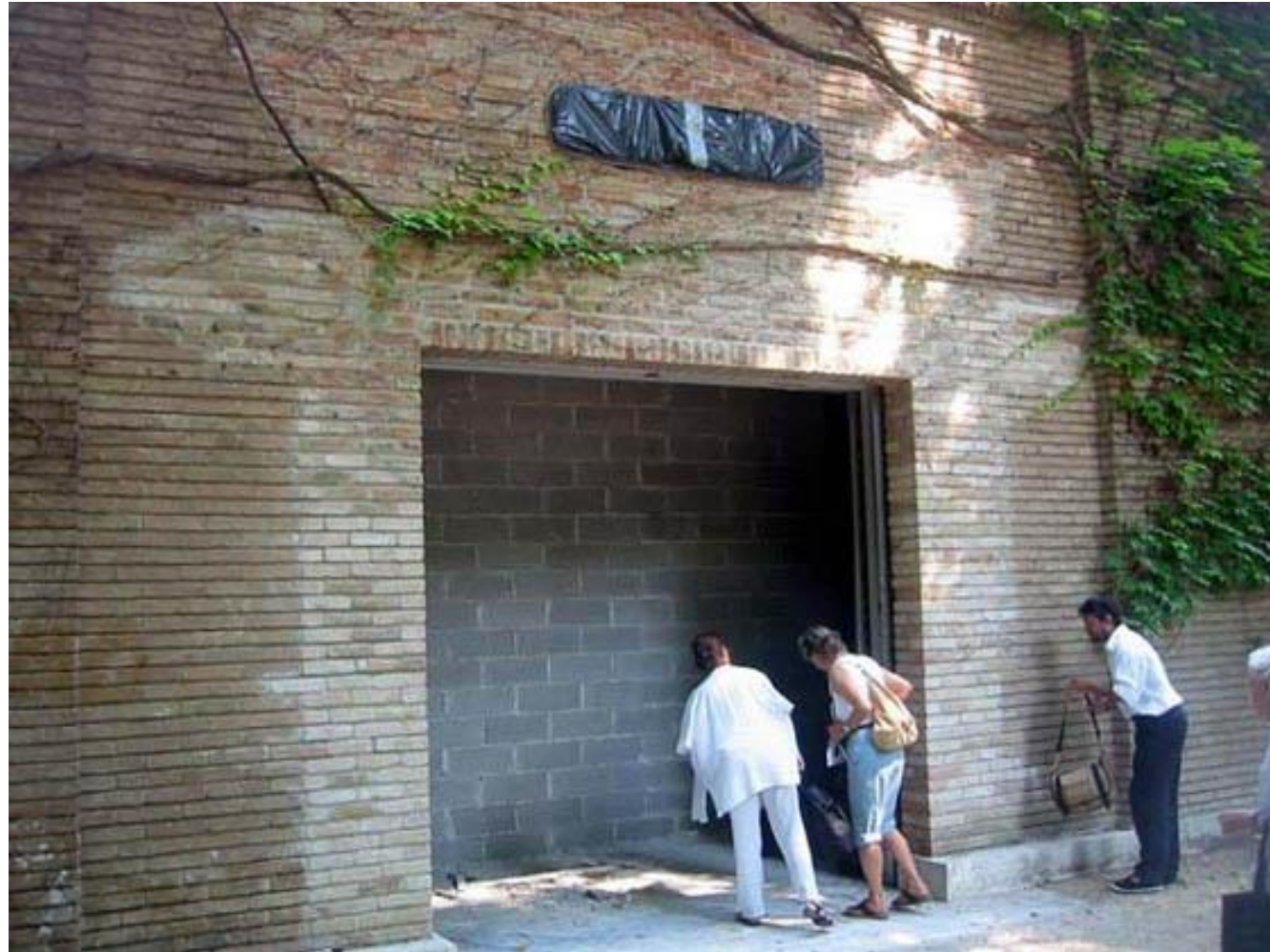
Muro cerrando espacio